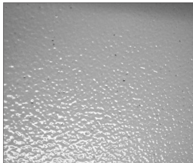
CAB-Punkte als Störungen im Strukturpulverlackfilm: Dabei handelt es sich um nicht aufgeschlossene Polymerbestandteile, die eine gewisse Verunreinigung des Strukturierungsmittels darstellen.