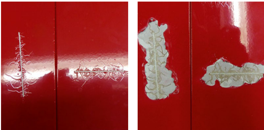
Abb. 1 zeigt ein Beispiel für Filiformkorrosion. Links ist die Unterwanderung des Lackfilms durch die Filiformfäden erkennbar, rechts ist der gleiche Bereich entlackt und die Filiformkorrosion offengelegt.

Aktuelle Ergebnisse zu Untersuchungen an voranodisierten und pulverbeschichteten Aluminiumprofilen